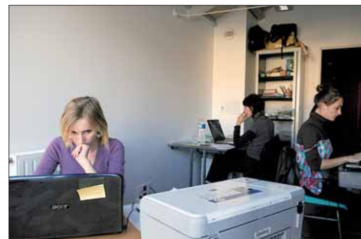
Les associations disposent de bureaux partagés et bénéficient d'une logistique moderne (ici, les jeunes animatrices du Théâtre des tours)