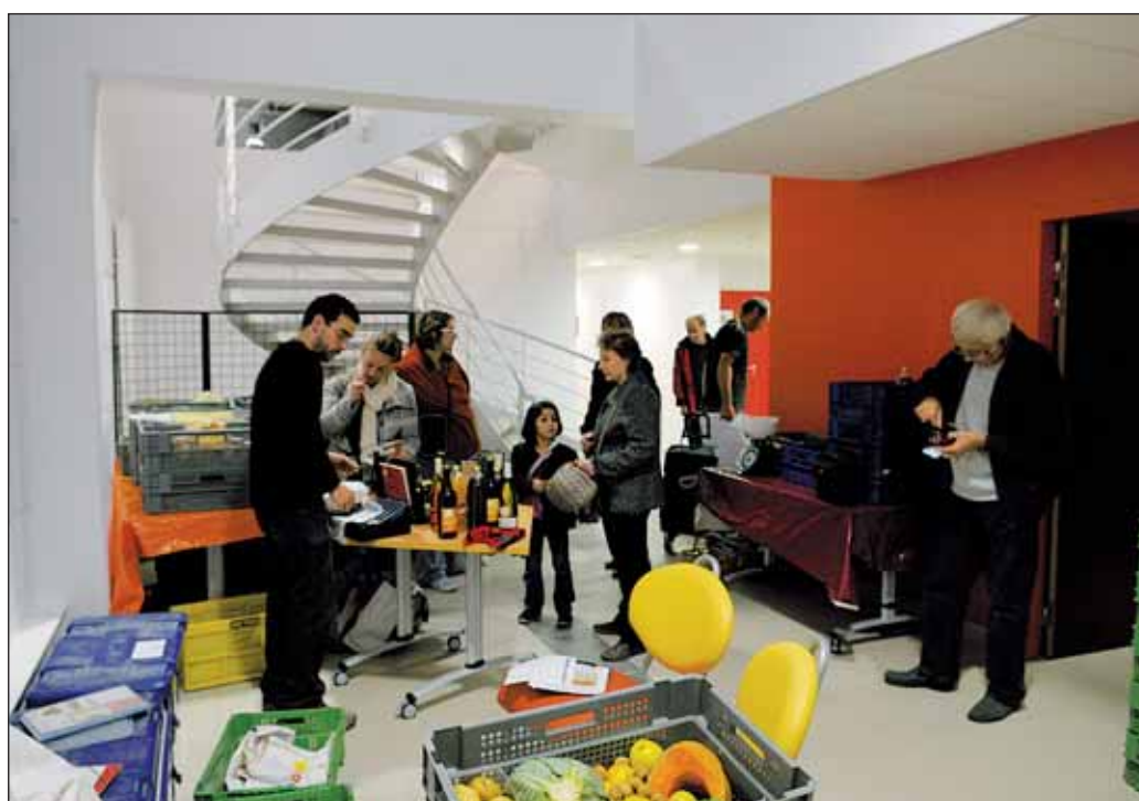
Tous les mercredis de 17h30 à 19 heures, Alter-Conso installe dans le hall de Boris-Vian ses paniers remplis de produits agricoles locaux, réservés par les adhérents de l'association