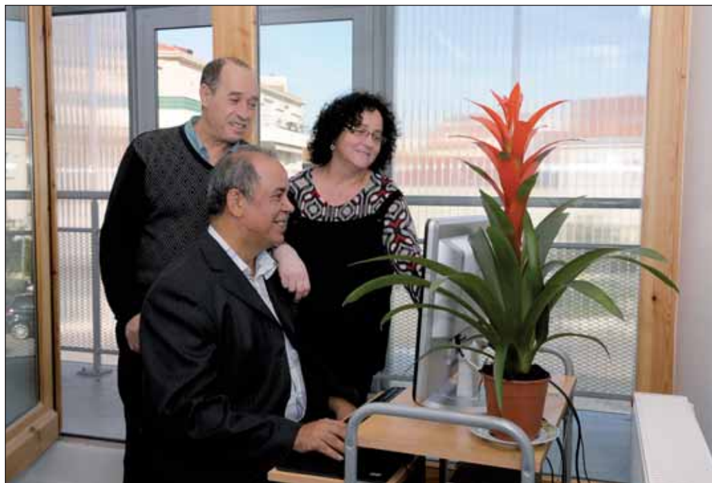
Les amis de Diwan ont désormais un bureau dans "la Maison", qu'ils partagent avec une autre association

Au cœur même de Vénissieux, le partenariat