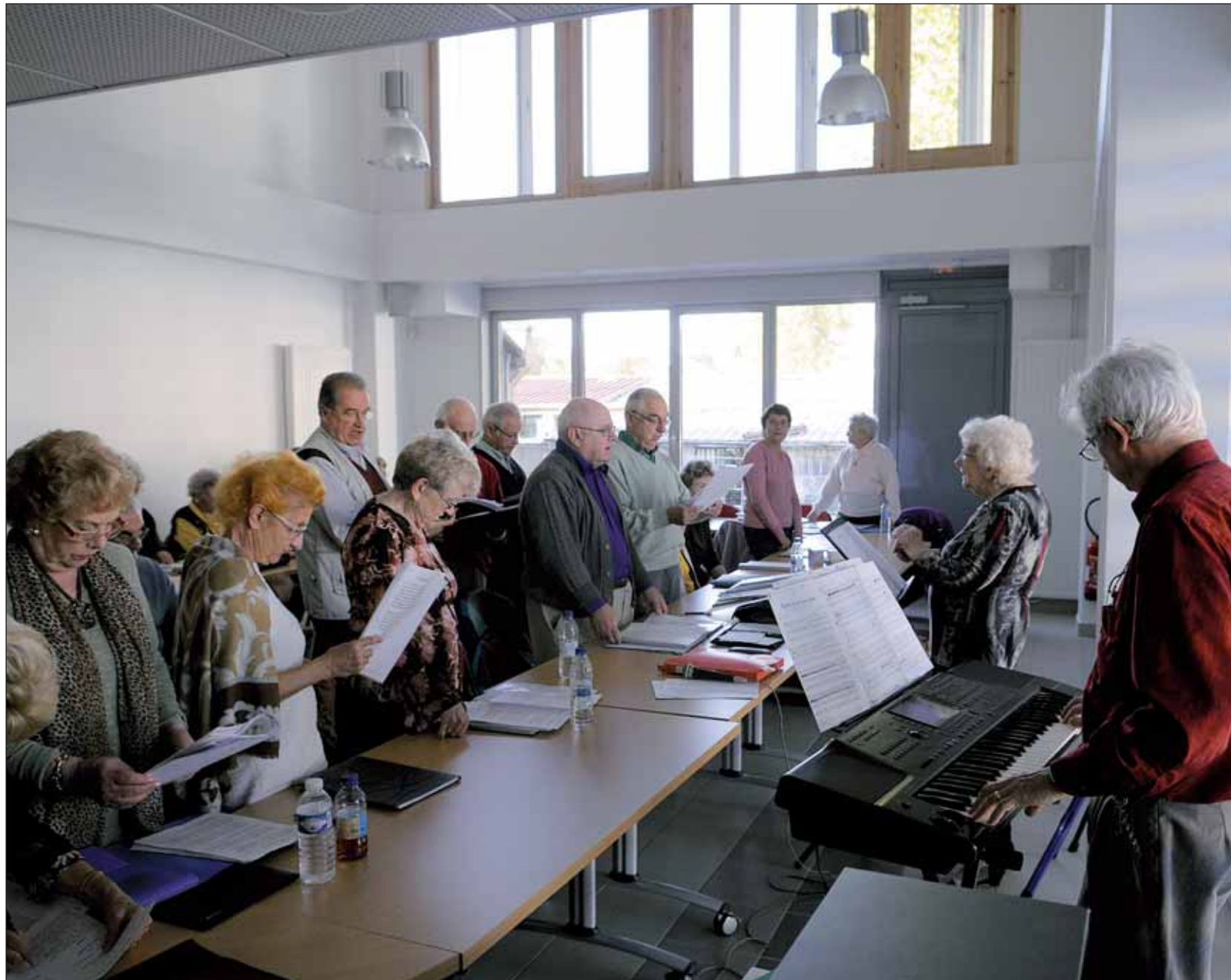
Des collégiens aux retraités, chacun peut trouver sa place dans la nouvelle maison des associations (ici, la chorale Debussy)

Bien installé dans le nouveau, beau et vaste bâtiment municipal construit sur l'avenue Marcel-Paul, le centre associatif Boris-Vian réfléchit à la mise en place de projets collectifs. En offrant des salles de réunion, en proposant des mises en réseau, en jouant pleinement son rôle de maison des associations. Lesquelles ouvrent la pyramide des âges puisqu'on trouve désormais à Boris-Vian des associations juniors, dès 14 ans, et d'autres dont les membres sont retraités.