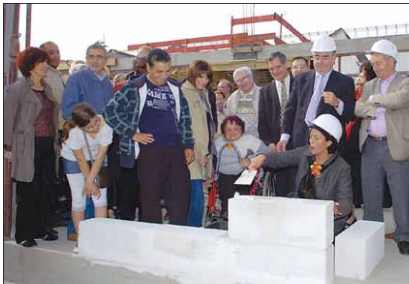
Samedi dernier, la présidente de Boris-Vian posait symboliquement avec le maire et les élus le premier bloc de béton cellulaire

Satisfait de constater que "tout le conseil municipal républicain était