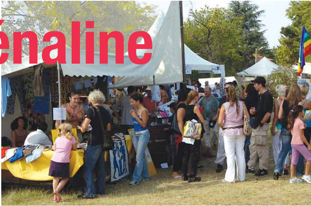
Organisé par Boris-Vian, le village de la Nuit métisse (ici en 2006) regroupera principalement en septembre prochain des stands d'associations vénissiennes

"Nous avons également un projet intergénérationnel né de la foire aux idées. Il lie sept associations, auxquelles s'ajoutent plusieurs partenaires, et a été baptisé: "Des mots, des saisons et une courge". Il se réalisera en deux ans et en trois temps."